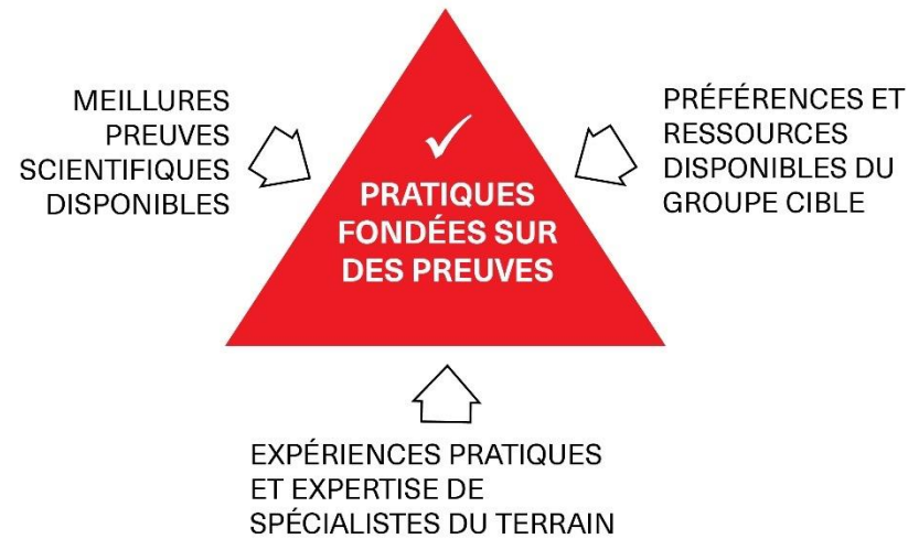
Figure 1 Les pratiques fondées sur des preuves

Les lignes directrices 2020 épousent les principes de pratiques fondées sur des preuves (données probantes) :